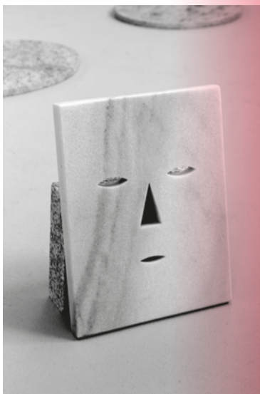
↑ Sári Ember , Untitled (Mask No 6.) , 2017, marble, 29,5x23x2 cm.

Artistul Jonathan van Doornum este prezent cu mai multe sculpturi în expoziția Peisaj în oglindă convexă , una dintre ele fiind Transmițător rotund